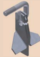
Noże skrzydełkowe i wertykulacyjne